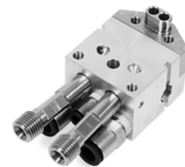
Colector del orificio trasero