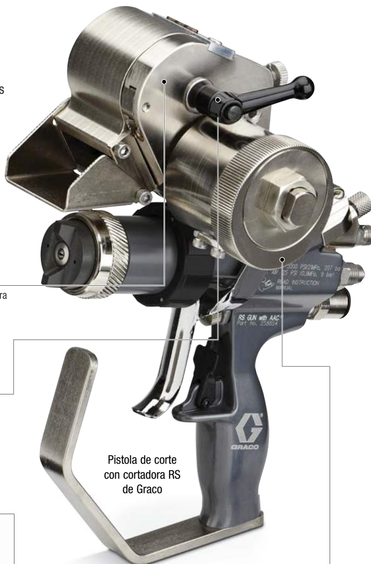
Pistola de corte con cortadora RS de Graco