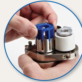
Reemplácelo por el cartucho nuevo