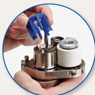
Extraiga el cartucho de cuchillas usado