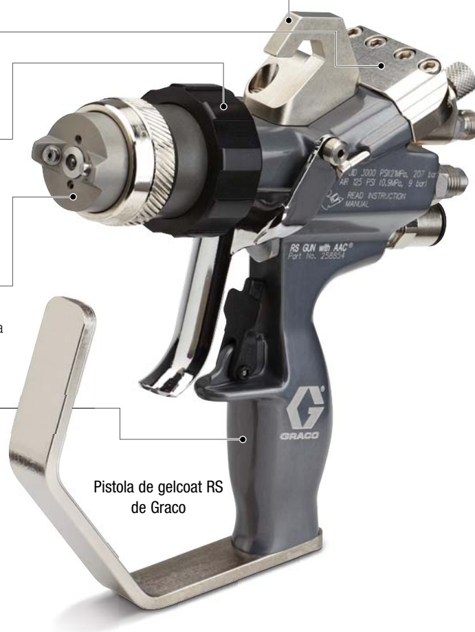
Pistola de gelcoat RS de Graco

Las pistolas de gelcoat y de corte RS de Graco están disponibles en modelos de mezcla interna y externa