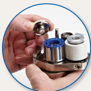
Retire el mecanismo de cierre