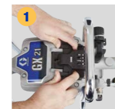
1 Deslice y levante la tapa de acceso para abrirla