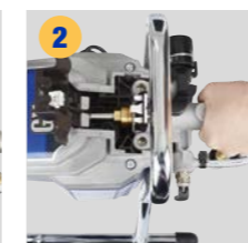
2 Extraiga la sección de la bomba